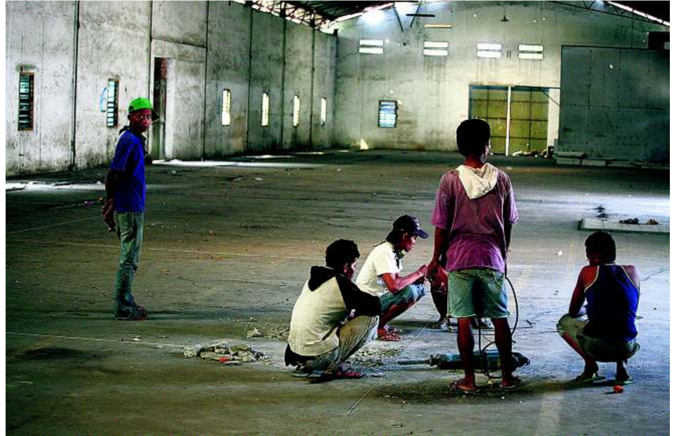
Theologische hogeschool Setia is gehuisvest in een oud fabriekspand. In de vervallen fabriekshallen moeten leslokalen en internaatkamers komen.

In alles wat ze doen lijken ze de naam van hun school echter eer aan te doen. Ze zijn trouw (Setia) aan hun God en geen klacht komt er over hun lippen. Dat geldt trouwens ook voor het vrouwelijke deel van de studenten, die elke ochtend vanuit een paar kilometer verderop gelegen internaat naar de campus komt. Wanneer de toiletten gereed zijn, hopen zij ook naar het terrein te verhuizen. Tot die tijd reizen ze echter elke ochtend trouw van het internaat naar de fabriek om daar te leren over God.