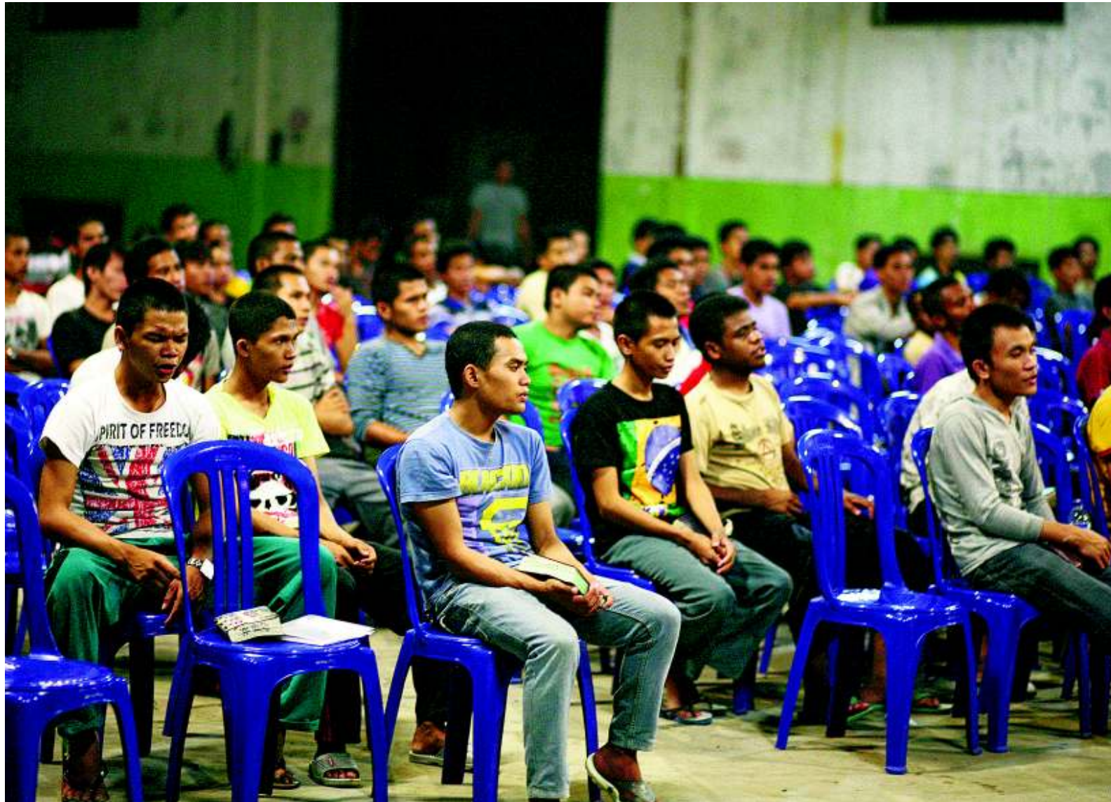
Studenten van theologische hogeschool Setia in Jakarta in de tijdelijke aula van het gebouw.